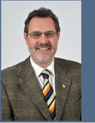
Josef Janker 1. Bürgermeister Stadt Bad Tölz